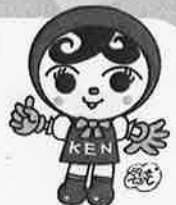
人権イメージキャラクター 人KENあゆみちゃん

*「多文化共生」って? 多文化共生とは、「国籍や民族などの異なる人々が、互いの文化的な違いを 認め合い、対等な関係を築こうとしながら、地域社会の構成員として共に 生きていくこと」と定義されています。 (「多文化共生の推進に関する研究会報告書」平成18年3月総務省より)