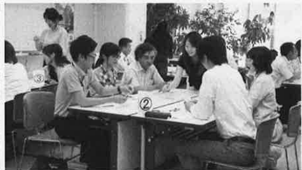
写真(多文化共生担当職員基礎研修会より)