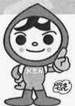
人権イメージキャラクター 人KENまるる君

*「多文化共生」って? 多文化共生とは、「国籍や民族などの異なる人々が、互いの文化的な違いを 認め合い、対等な関係を築こうとしながら、地域社会の構成員として共に 生きていくこと」と定義されています。 (「多文化共生の推進に関する研究会報告書」平成18年3月総務省より)