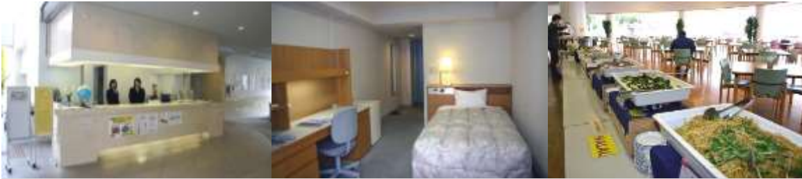
フロントは英語でも OK！ 宿泊室は 1人部屋。ホテルのようです。レストランもあります。