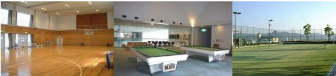
無料でジムやバドミントン、卓球、ビリヤード、テニスなどができます。道具も借りることができます。