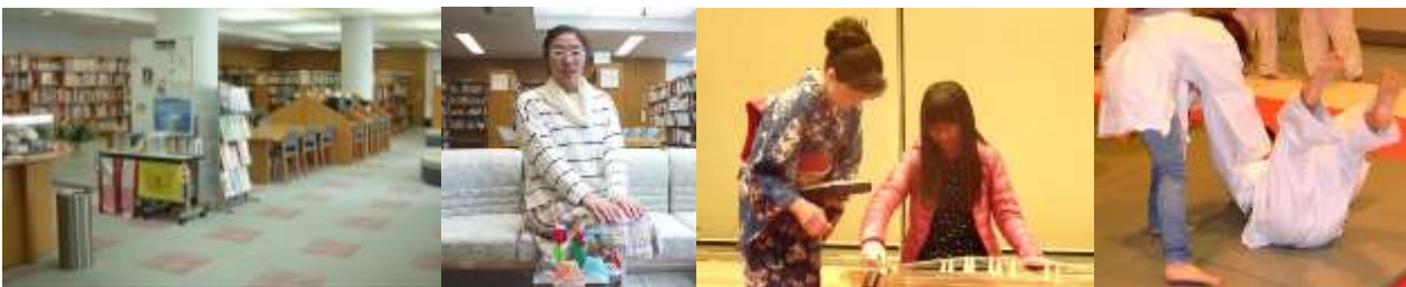
図書室ではマンガや DVD を借りたり、折り紙を教えてもらったりできます。ロビーでは時々文化体験イベントも♪