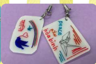
ブラバンキーホルダー

いろいろな国の言葉で「平和」の文字を書いて、キーホルダーをつくろう！ （どちらか一つだけです。）