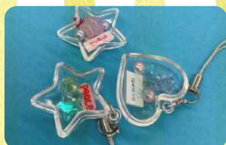
カプセルキーホルダー